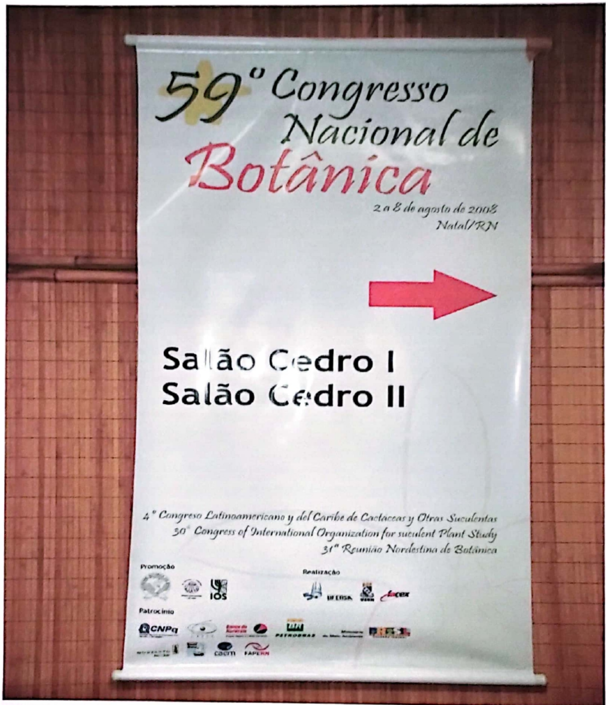
Figura 6. Banner indicando a localização dos auditórios Cedro I e II, evidenciando os patrocinadores.