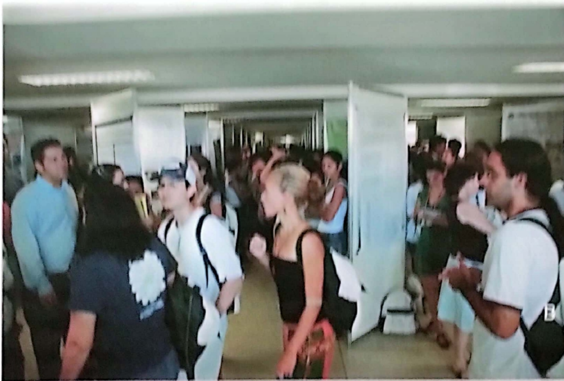
Figura 5. Centro de Exposições do Praiamar Natal Hotel, local onde foram apresentados os pôsteres.